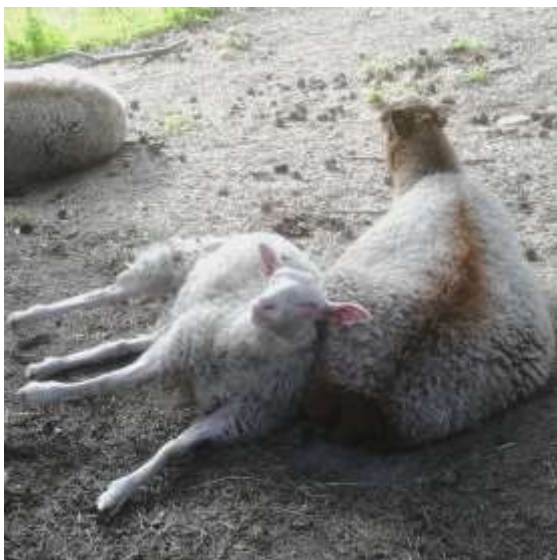
Kenkäveron puutarhassa kesiään viettävät lampaat, kanat ja puput ovat yleisön suosikkeja.

Kenkäveron kävijämäärä laski edellisestä Asuntomessuvuodesta merkittävästi. Poikkeuksellisen helteinen kesä verotti kävijöitä niin Kenkäverossa kuin yhdistyksen muissa toimipisteissä.