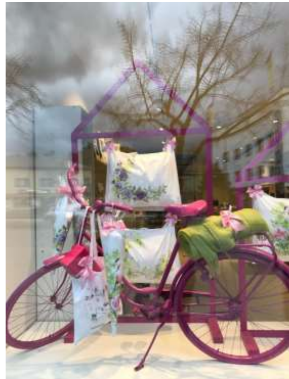
Pieksämäen toimitiloissa tehtiin keväällä remontti kurssitiloissa sekä myymälässä. Avajaiskahveja juotiin toukokuussa.